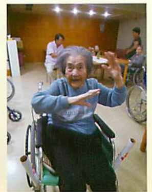
盆踊りの余韻が残ります♪