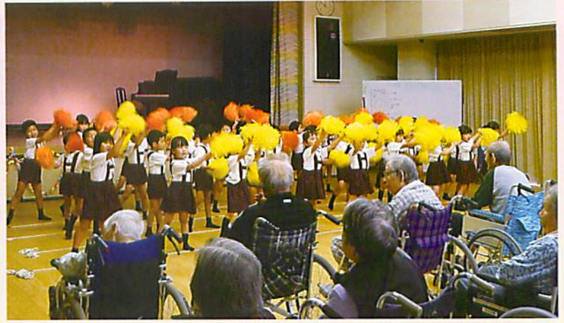
幼稚園の子どもたちとゴスペルサークルにお越し いただき、歌やダンスを披露していただきました。