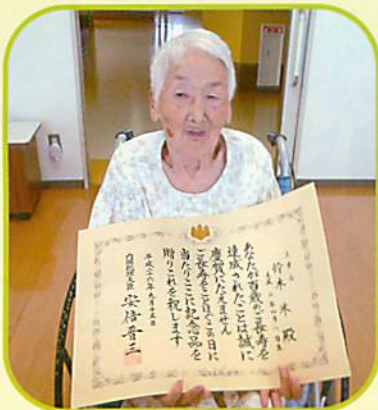
ご自分で車椅子も操作されます。 いつまでもお元気でいてください。