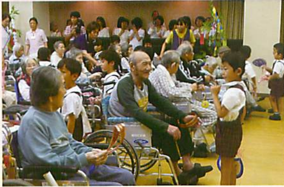
子どもたちからうちのプレゼント。 お返しにメダルを贈りました。